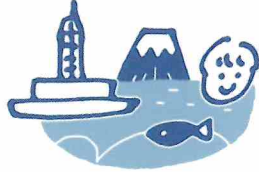
海のみらい静岡友の会

主催：静岡商工会議所 海のみらい静岡友の会 協力：東海大学海洋学部博物館 後援：静岡市教育委員会 助成：日本財団